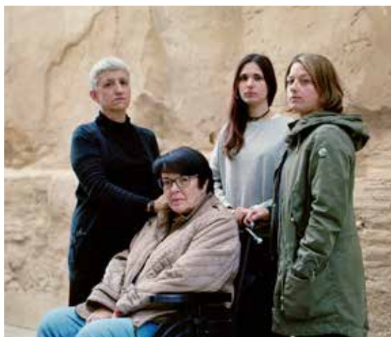
Fotografía de la obra.