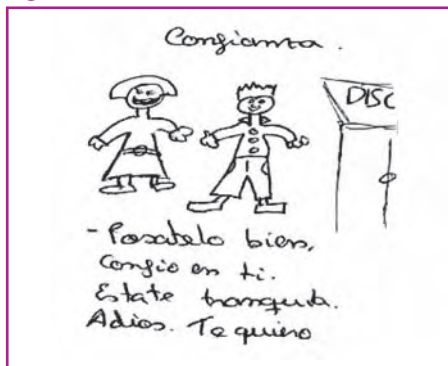
Figura 2. Confianza chico 16 años