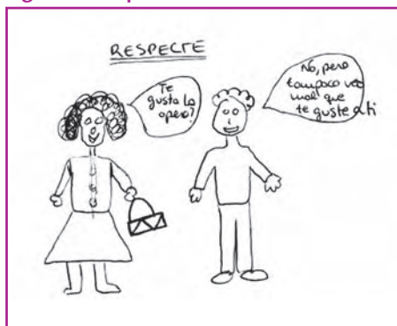
Figura 3. Respeto chica 16 años