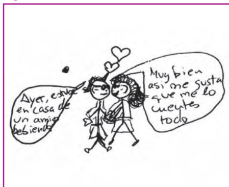
Figura 1. Confianza chica 16 años