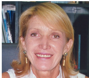
Teresa Blat Gimeno

DIRECTORA GENERAL DEL INSTITUTO DE LA MUJER