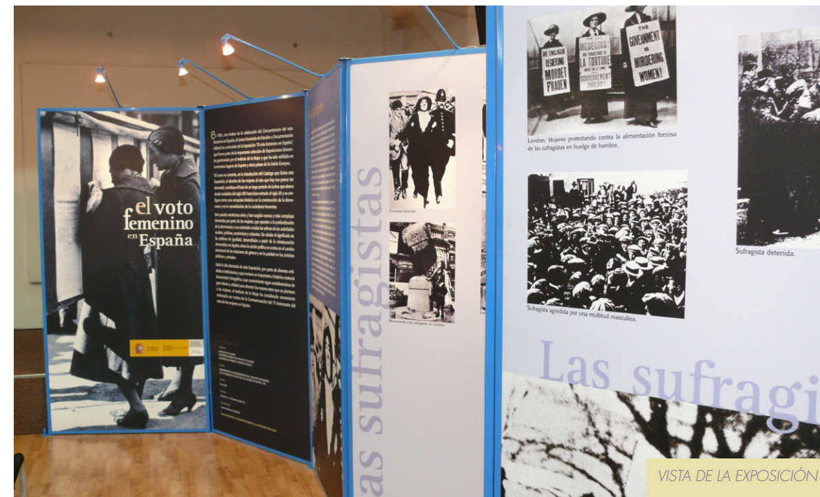
VISTA DE LA EXPOSICIÓN

LA MESA CONTÓ CON PERSONALIDADES DE RECONOCIDO PRESTIGIO QUE VIENEN DESARROLLANDO UNA IMPORTANTE Y CONTINUADA LABOR EN EL ÁMBITO DE LA IGUALDAD DE GÉNERO