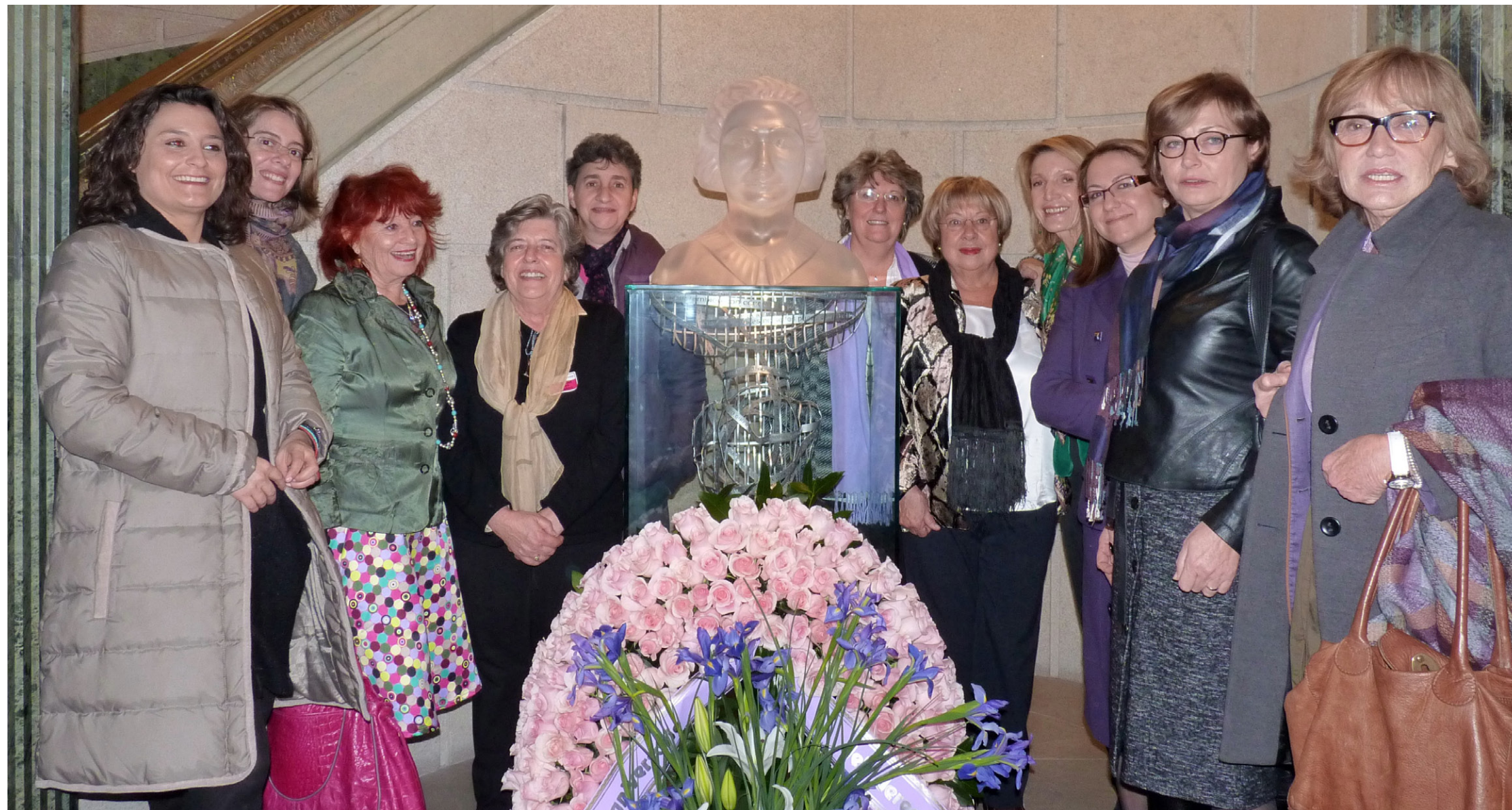
BUSTO DE CLARA CAMPOAMOR EN EL CONGRESO.